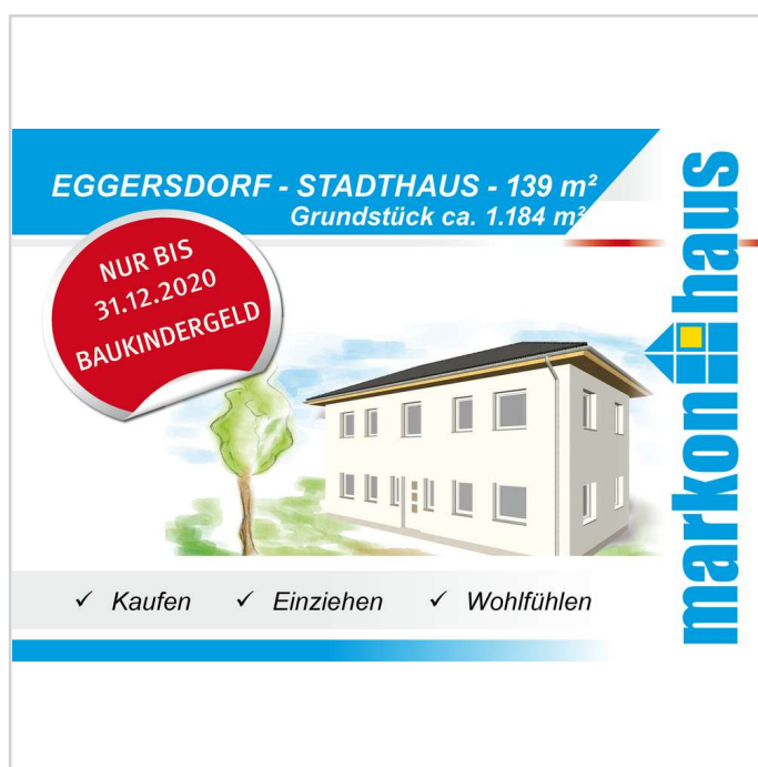
Eggersdorf - Bötzeestraße Hau